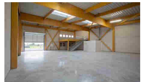
Atelier vu de l'intérieur