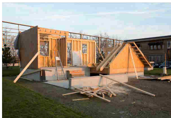
MBOC RT 2012 BATIR