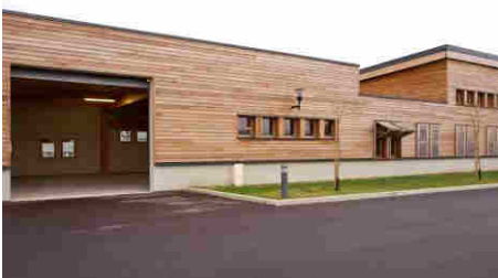
Atelier vu de l'extérieur

En plus des bureaux de l'hôtel et pépinière d'entreprises, la Fabrique 21 propose 10 ateliers prêts à l'emploi de 281 m 2 et de 320 m 2 aménageables.